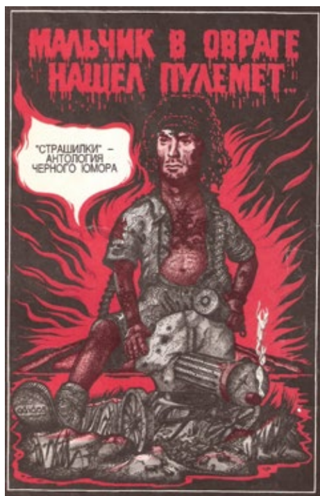
Рисунок 2. «Страшилки» — антология черного юмора. Издательство «Парус». Минск. 1993. Художник А. М. Сафонов.

Вместе с тем, в 1993 году Александром Белоусовым зафиксирован сюжет, когда сыктывкарская прокуратура по заявлению местных учителей проверяла сборник детских садистских историй на предмет пропаганды насилия и жестокости (статья 228 УК РСФСР), однако состава преступления в действиях составителя сборника не обнаружила, хотя тираж сборника конфисковали, а с составителя взыскали штраф (Белоусов 1995, 1998: 552). Аналогичная ситуация произошла осенью 2017 года: в российской прессе и социальных сетях появилась информация о том, что против краснодарского поэта-распространителя стишков возбуждено уголовное дело о разжигании ненависти к атеистам 2 . В действиях поэта, с его